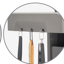
Ganchos para ferramentas