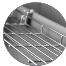
Grade de apoio suspensão