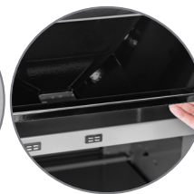
Sistema Coletor de Gordura