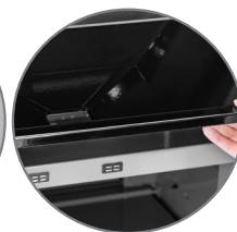
Sistema Coletor de Gordura