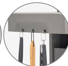
Ganchos para ferramentas